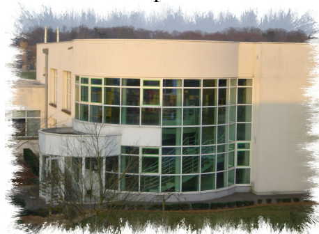
C.D.I. et C .D.R. « Espace Ouvert de Formation ».

Le CFPPA met à disposition des bénéficiaires une salle multimédia avec supports pédagogiques et un Centre de Ressources « Espace Ouvert de Formation ».