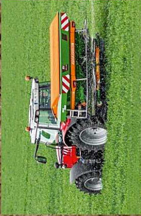
épandage d'engrais sur orge

Le matériel en agriculture conventionnelle