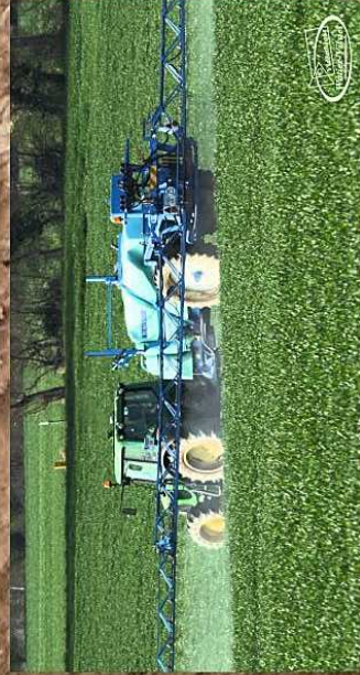
pulvérisation sur blé

L'agriculture conventionnelle, conduite sur l'exploitation est un système de production agricole basé sur un niveau de la production agricole en cohérence avec les facteurs de production.